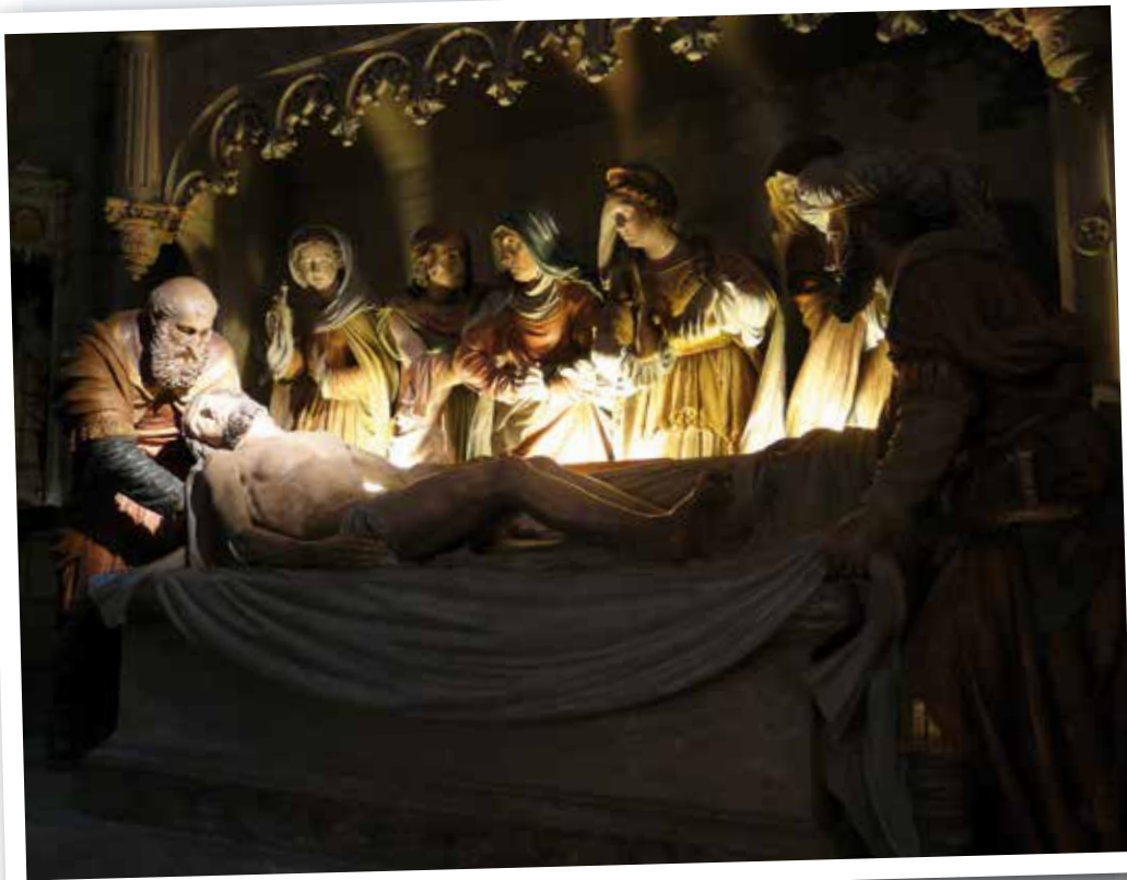
Mise au tombeau Église d'Amboise