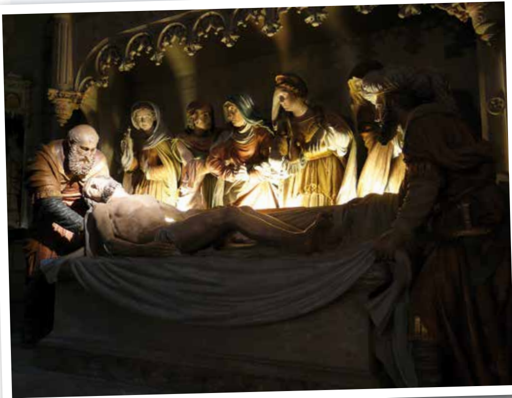
Mise au tombeau Église d'Amboise